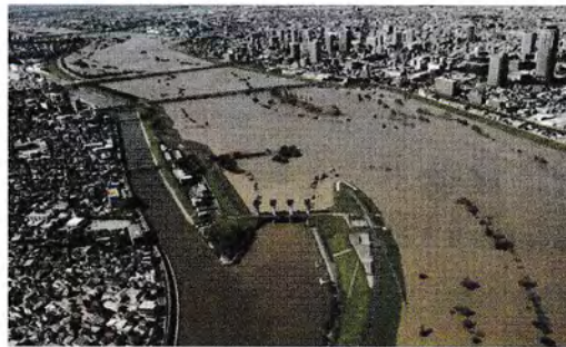
「令和元年東日本台風に伴う増水した荒川」

マイ・タイムラインとは、自分自身が災害発生の数日前又は数時間前から発生までの間に何をすべきかを事前に決めておくものです。