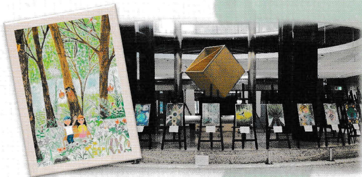
緑化運動ポスター原画募集入賞作品展 (東京都庁にて表彰式と作品展開催)