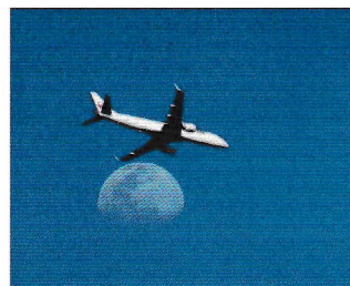
最優秀賞 矢島 智志 (鷺宮部門)