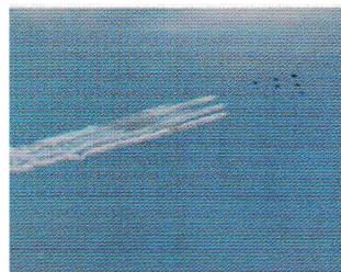
最優秀賞 大野 茉白 (子供部門)