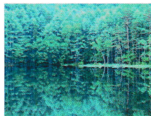
最優秀賞 三那川 弘恵 (自由部門)