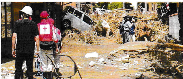
令和4年8月豪雨災害