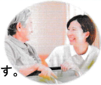
介護のしごとの基礎を楽しく学ぶ!

介護のお仕事に興味のある方を対象に、基礎的な介護知識が身につく講座を開催いたします。 介護に関する基礎知識、介護の基本、基本的な介護の方法、介護における安全確保、認知症や障害の理解などを学びます。 研修終了後も、ご希望の方には 就労支援サポート をさせていただきます。 経験がない方もお気軽にご参加ください。