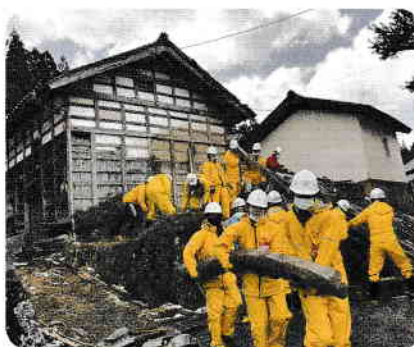
金沢工業大学の学生たちもボランティアとして応援してくれています。(穴水町)

共同募金会では、災害発生後、即座に災害支援を行えるように皆様からのご寄付金の一部を、災害等準備金として積立しています。この準備金は、被災県に設置の災害ボランティアセンターやボランティア団体の活動支援などに活用する共同募金独自の、災害時におけるたすけあいのしくみです。