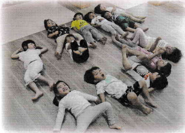
(N)KOTOともそだちネット 陽だまり保育園「こどもたちの保育室を整備しました。」

赤い羽根共同募金は子ども・家庭、高齢者、障がい者、まちづくりの推進など皆様に関わりのあるところで役立てられております。